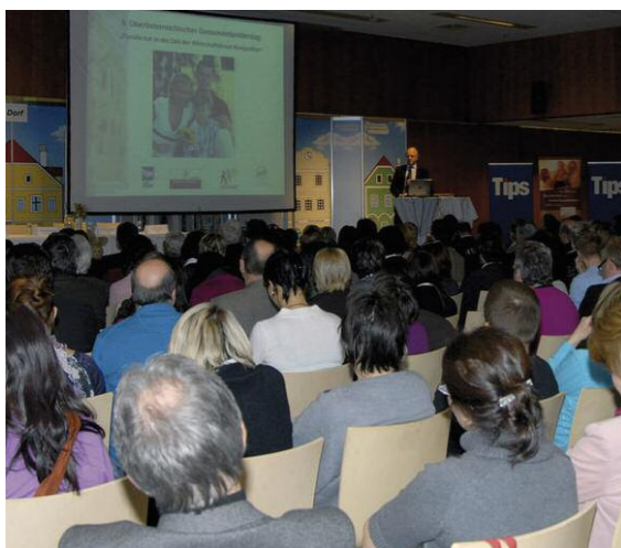
5. Oö. Gemeindefamiliientag März 2010

Nähere Informationen sowie die Einladung finden Sie auf www.familienkarte.at - Regionale Familienpolitik. Um Anmeldung per E-Mail an familienreferat@ooe.gv.at oder unter der Telefonnummer 0732/7720-11584 wird gebeten.