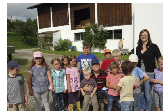
Die Kühe sind los - alles rund um den Bauernhof