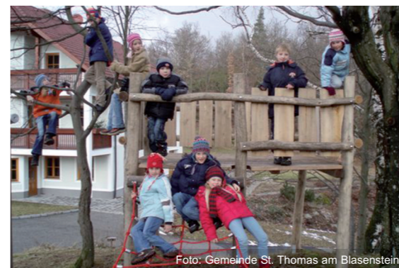
Spielplatz St. Thomas am Blasenstein

Der Spielplatz von St. Thomas bildet seit jeher ein zentrales Freizeit- und Erholungsgelände für die Kinder aus dem ei-